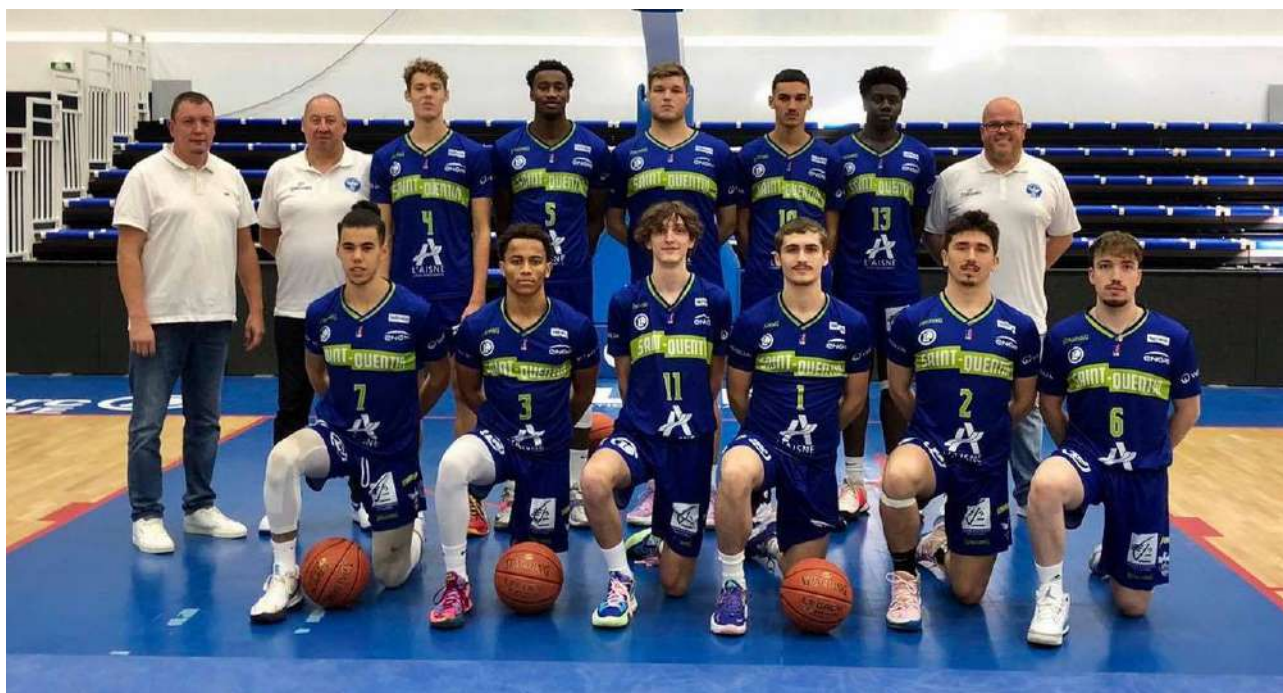
ESPOIRS PROB – SAISON 2021/2022

Le centre de formation du Saint-Quentin Basket Ball se doit de porter les valeurs de sa région et du club : Solidarité – Proximité – Respect.