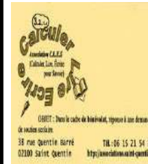
Association CLES Soutien Scolaire