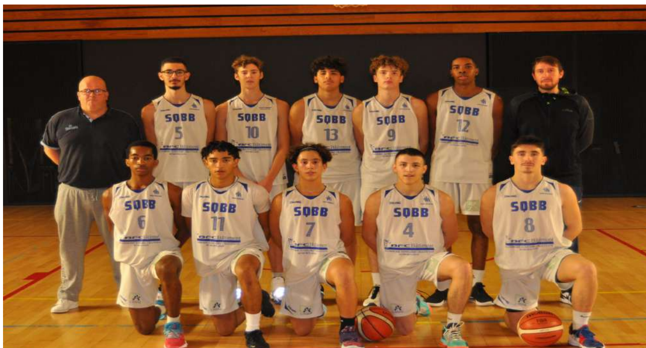
U18 ELITE – SAISON 2021/2022

* Entraînements du jeudi et vendredi soir en fonction de l'équipe professionnelle (Palais des sports ou B.Gamess)